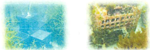
写真2 鋳鉄で作製した魚礁した (左) および多孔質溶出ブロック上への海藻の成長 (右)

二価鉄-フルボ酸錯体の形成確認に関しては、これまで報告が無かったため、嫌気性条件下で二価鉄を飽和吸着させた新しい反応型のゲルクロマトグラフィーを開発して錯体の形成を確認した。